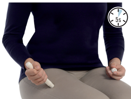
Trykk mot låret, og det høres et klikk. Hold i 5 sekunder. Masser så injeksjonsstedet. Ring 113.