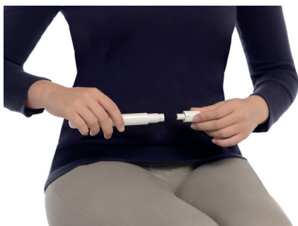
Ta bort nålskyddet